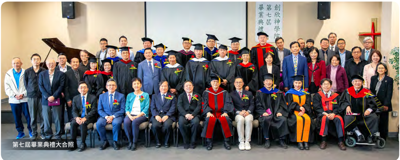
第七屆畢業典禮大合照

（主編按：創欣神學院2025年第七屆畢業生共34位，分佈於全球各地。本期畢業生感言，是經其本人同意刊登，其中有不便刊登真實姓名的，以別號稱呼。感言內容由主編加以編輯之後刊登。）